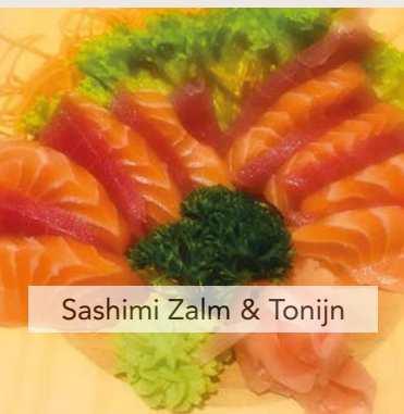
Sashimi Zalm & Tonijn