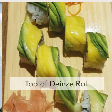
Top of Deinze Roll