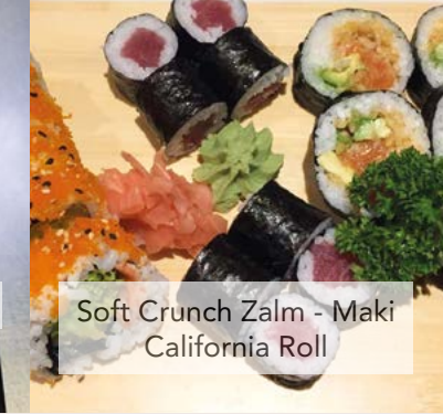
Soft Crunch Zalm - Maki California Roll