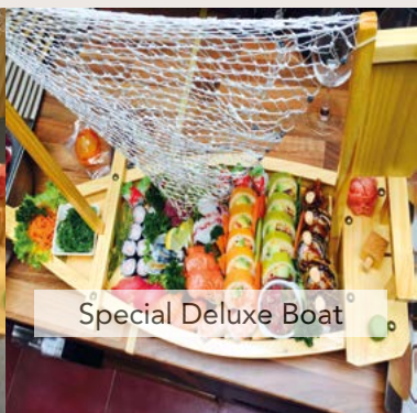
Special Deluxe Boat