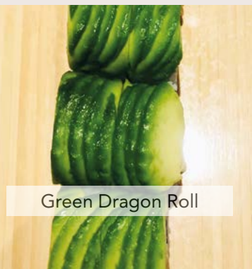
Green Dragon Roll