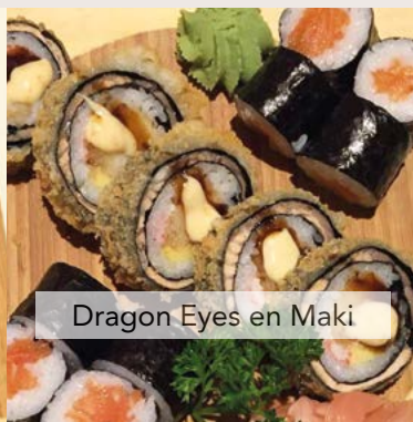
Dragon Eyes en Maki