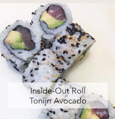
Inside-Out Roll Tonijn Avocado