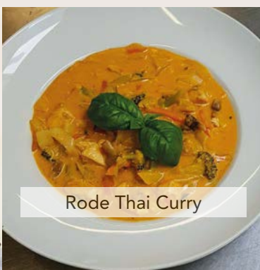
Rode Thai Curry